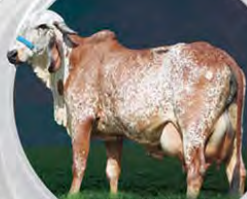
HONESTA FIV DO BASA MÃE

Mais uma oferta de 50% das cotas do atual 2º Maior valor Genômico entre as fêmeas Jovens do Gir Leiteiro, com a expressiva marca de 808 kg de GPTA/Leite, Babaculândia descende de uma das principais filhas da Fábrica, Honesta FIV do Basa. Esse acasalamento de Babaculândia, produziu o Touro em Teste de Progenie ABCGIL/Embrapa, Bilac FIV do Basa e mais várias filhas destaque entre as Top 10% Fêmea Jovem. O que há de melhor nas Fazendas do Basa está sendo ofertado nesse lote. Prenha de embrião do acasalamento (NILCE X FABULOSO) com p. parto para 12/01/20.