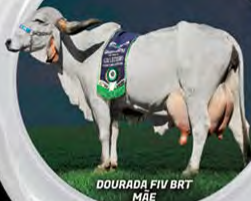
DOURADA FIV BRT MÃE

Mais uma grande oportunidade da família Tática!!! Cordilheira FIV do Basa descende da Grande Campeã Torneio Leiteiro Franca e Reservada Grande Campeã Torneio Leiteiro Expozebu, Dourada FIV BRT.