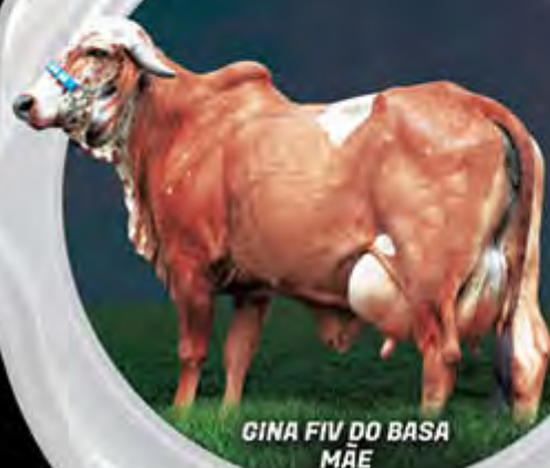
GINA FIV DO BASA MÃE

13.935 KG DE LEITE. GPTA LEITE =645 KG/EMBRAPA/ABCGIL.