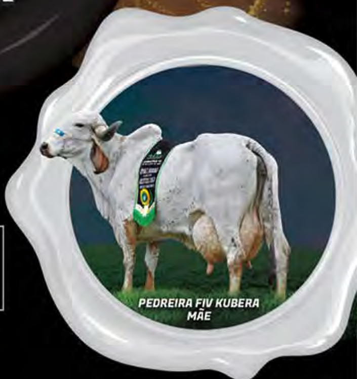
PEDREIRA FIV KUBERA MÃE

Catolândia FIV do Basa descende da Grande Campeã Torneio Leiteiro Araxá, Pedreira FIV Kubera, doadora que descende de Filipina Kubera, uma irmã completa dos provados Facho e Faraoh Kubera.