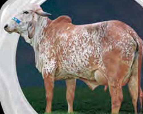
NILMARA FIV DO BASA MÃE

13.935 KG DE LEITE. GPTA LEITE =645 KG/EMBRAPA/ABCGIL.