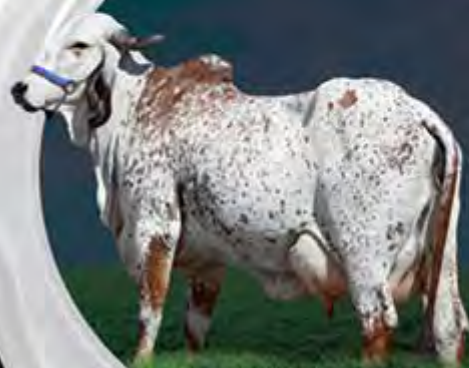
JESEBEL FIV DO BASA MÃE

13.935 KG DE LEITE. GPTA LEITE =645 KG/EMBRAPA/ABCGIL.