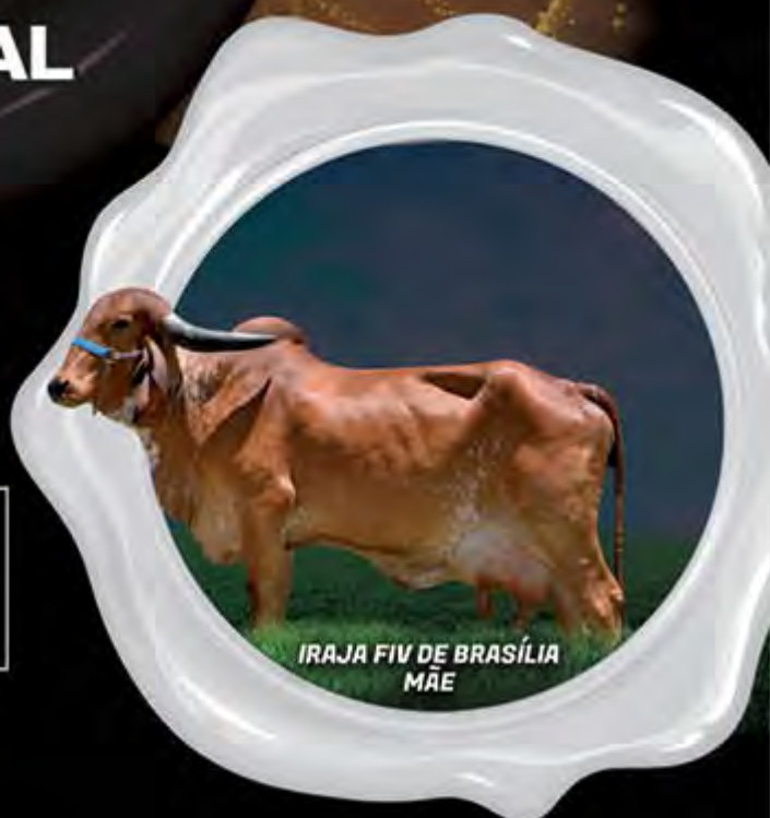
IRAJA FIV DE BRASÍLIA MÃE

Mais uma grande oferta das Fazendas do Basa no leilão Sob a Luz do Genoma, Faxinal está entre as TOP 10% GPTA/Leite, com o expressivo valor de 366 kg. Linha materna de muita consistência, já que sua mãe Irajá de Brasília, com GPTA de 384 kg, sendo irmã materna de Fábrica de Brasília.