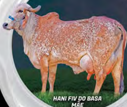
HANI FIV DO BASA MÃE

13.935 KG DE LEITE. GPTA LEITE =645 KG/EMBRAPA/ABCGIL.