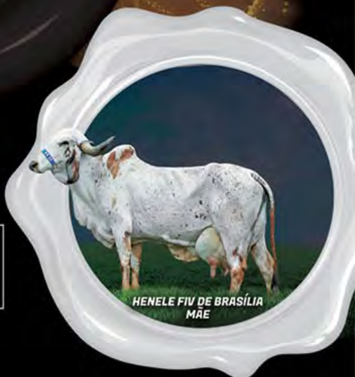
HENELE FIV DE BRASÍLIA MÃE

Batistina FIV do Basa impressiona muito em seu desenvolvimento, sua estrutura, comprimento corporal e muita força leiteira. Pedigree que reúne Juliana Cal, Surpresa de Brasília e Luziada de Brasília. Mais uma novilha de muito futuro!!!