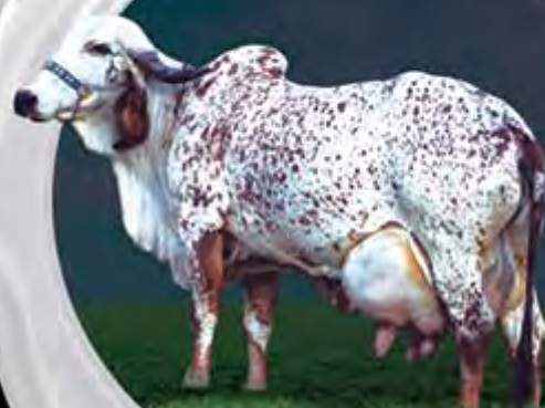
FORTUNA FIV DE BRASÍLIA MÃE

Charme FIV do Basa impressiona pela força leiteira em seu fenótipo, desenvolvimento corporal e pedigree de muita consistência e linha materna que reúne a família do Touro número 1 do PNMGL, Ivã de Brasília.