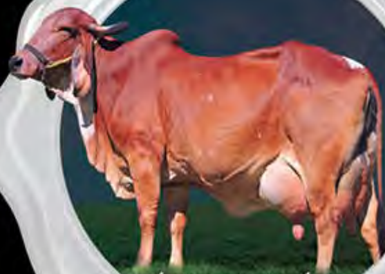
FÁBRICA FIV DE BRASÍLIA AVÓ MATERNA

Pacote completo ofertado nesse lote!!! Novilha de muita estrutura, volume corporal, força leiteira, pedigree de extrema qualidade e para completar um dos maior GPTA's/Leite no nosso Leilão. Agregando ainda mais esse lote Barroquinha segue com prenhez sexada de fêmea da Insensata FIV do Basa com Jaguar, prenhez irmã completa de Otilia FIV do Basa, nº 1 do Genoma entre as Fêmeas Jovens. Com p. parto para 29/03/20.