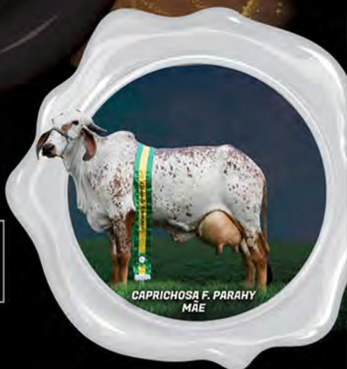
CAPRICHOSA F. PARAHY MÃE

Açucena FIV do Basa possui características funcionais impressionantes, força leiteira evidente, muita estrutura, volume corporal. Pedigree muito consistente, GPTA/Leite de 261 kg e linha materna da Bi-Grande Campeã Nacional e Recordista Mundial de lactação, Profana de Brasília. Açucena segue com prenhez sexada da Campeã Vaca Jovem Torneio Leiteiro Uberlândia e Megaleite, Maia FIV do Basa, atenção para a oportunidade. Prenha de embrião do acasalamento (MAIA X SANSÃO) com p. parto para 15/12/19.