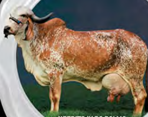
NEFRITA IV DA PALMA AVÓ MATERNA

Única oferta da família Nefrita do nosso leilão Sob a Luz do Genoma!!! Mas não é qualquer oferta, Carmópolis FIV do Basa impressiona em seu fenótipo, potencial para pista e principalmente potencial genético de muito futuro. Para quem busca equilíbrio em todos os pontos, aqui uma grande opção!!!