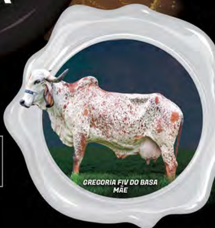
GREGORIA FIV DO BASA MÃE

13.935 KG DE LEITE. GPTA LEITE =645 KG/EMBRAPA/ABCGIL.