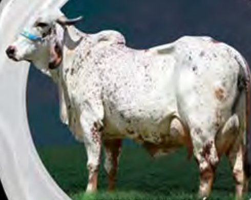
IBIUNA FIV DE BRASÍLIA MÃE

Fazendas do Basa ofertam Babel FIV do Basa, irmã materna do Touro em Teste de Progênie ABCGIL/Embrapa, Lusitano FIV do Basa. Babel descende de Ibiuna FIV de Brasília, irmã completa de Fábrica de Brasília. Babel reúne muita consistência genética e força leiteira evidente. Pacote 2 em 1!!! Prenha de embrião do acasalamento (NONATA X LUSITANO) com p. parto para 29/03/20.