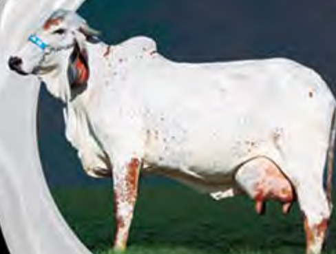
INSENSATA FIV DO BASA MÃE

13.935 KG DE LEITE. GPTA LEITE =645 KG/EMBRAPA/ABCGIL.