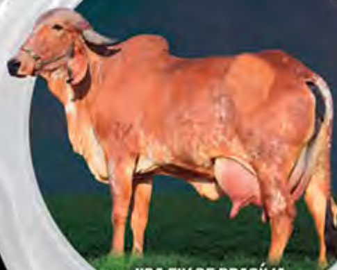
JIBA FIV DE BRASÍLIA MÃE

Doadora de embriões completa!!! Marjory FIV do Basa resume muito bem o intuito desse grande leilão, ofertar animais geneticamente evoluídos, provados e principalmente com garantia de evolução genética. Campeã Fêmea Jovem Torneio Leiteiro Franca, descendente direta da Bi-Recordista Mundial de Produção, Jiba de Brasília, fertilidade garantida, progênie de muita qualidade, irmã completa de Broinha FIV Cabo Verde (atual Recordista Mundial de Produção Vaca Jovem). Com certeza Marjory é uma das doadoras de maior destaque da nova safra Basa. Aprecie sem moderação!!! Prenha do JACUSTOR com p. parto para 15/01/20 .