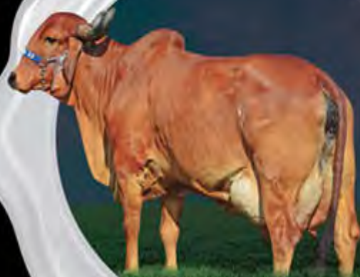
PROFANA XIV FIV DA PALMA MÃE

Mais um lote TOP 10% GPTA/Leite no nosso leilão. Centralina FIV do Basa com GPTA/Leite de 390 kg, pedigree altamente consistente, muita estrutura e volume corporal, com certeza mais um animal de muito futuro. Linha materna da grande Profana de Brasília.