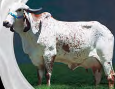
HARPADA TE BJS MÃE

Mais uma doadora de muita confiança da seleção Basa sendo ofertada!!! Liga FIV do Basa ultrapassou os 11.300 kg de leite/real, GPTA/Leite de 439 kg, fertilidade garantida e muita força leiteira em seu fenótipo. Oportunidade de adquirir uma doadora jovem, provada e principalmente pronta para ser multiplicada todo seu potencial genético. Prenha do JACUSTOR com p. parto para 28/12/19.