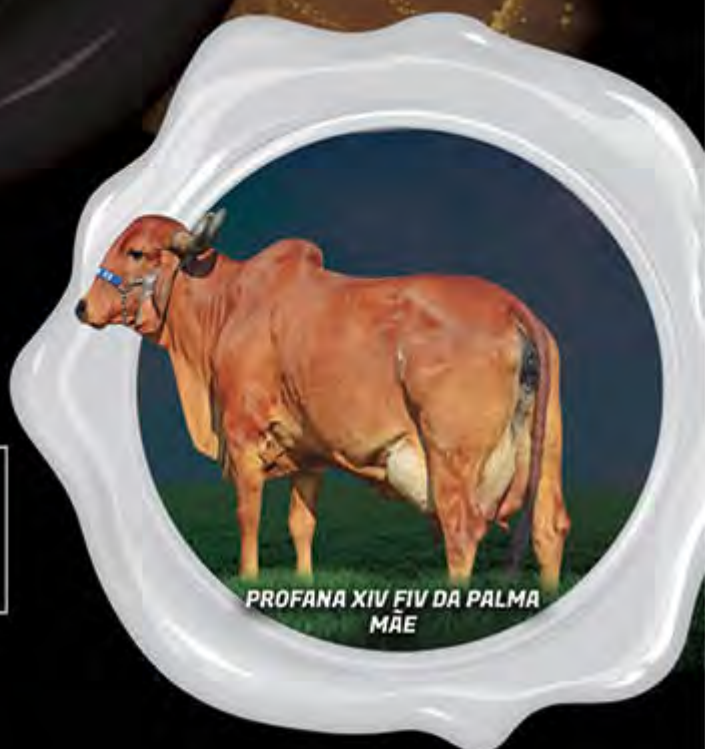
PROFANA XIV FIV DA PALMA MÃE

Com certeza um lote para quem busca muita estrutura, volume corporal e consistência genética. Omilia descende de uma das mais completas filhas da Bi-Grande Campeã Nacional e Recordista Mundial de Produção, Profana de Brasília. Profana XIV ultrapassou os 10.700 kg de leite, sendo mãe de Armador FIV do Basa, Melhor Macho do Ranking ABCGIL 16/17. Prenha do NÓBREGA com p. parto para 12/02/20.