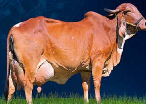
FÁBRICA FIV DE BRASÍLIA - AVÓ MATERNA

Família Fábrica e Dengosa juntas??? Aqui está sua grande oportunidade na noite do dia 17 de junho !!! Lote que es- banja qualidade genética. Não podem- os deixar de chamar atenção para a es- trutura corporal de Dalila. Não esqueça de entrar no site da Q2assessoria ( www.q2assessoria.com.br ), lá você poderá conferir com antecedência os vídeos de todos os animais ofertados no Leilão!