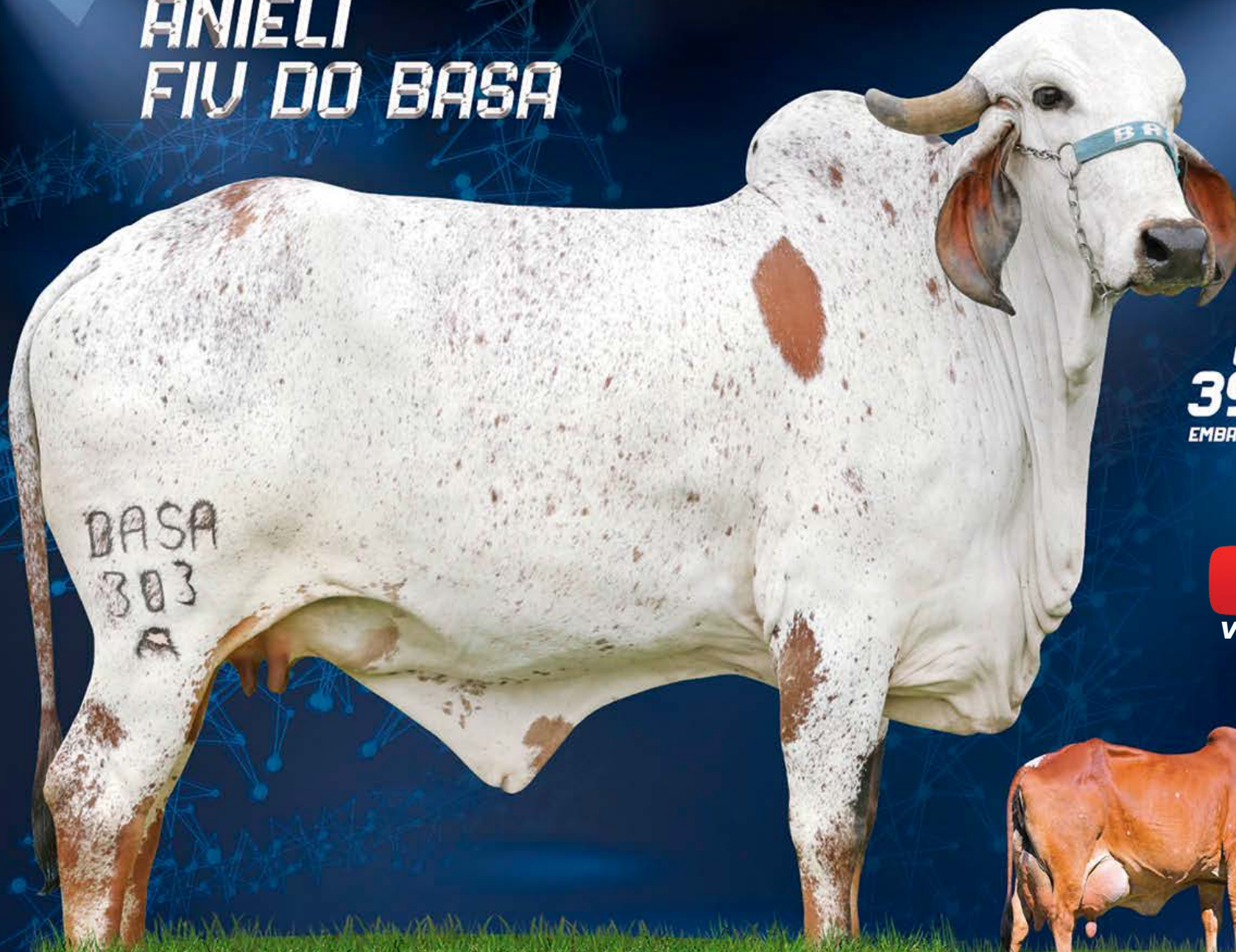
FÁBRICA FIV DE BRASÍLIA - MÃE

Destaque absoluto do Nosso Leilão, um dos acasalamentos mais comprovados e desejados da "Nossa Raça". Anieli FIV do Basa é irmã completa das respeitadas: Honesta, Gina, Nilmara, Gregória, Forcada, Julianne entre tantas outras doadoras de destaque e irmã materna do maior GPTA entres as Fêmeas Adultas, Amora. Prenha do Degas com p. parto para 23/05/20.