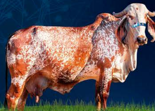
ORDENHA II DE BRASÍLIA - MÃE

Uma grande oportunidade para quem busca uma descendente do Provado Fabuloso do Basa. Sua mãe Ordenha II descende da Grande Campeã Torneio Leiteiro Brasília, Ordenha de Brasília, uma das principais Famílias da Tradicional Seleção Brasília.