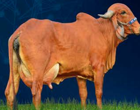
LETUZA DO BASA - MÃE