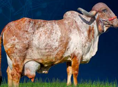
SOJA DE BRASÍLIA - BISAVÓ MATERNA